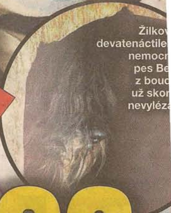
Žilková devatenáctiletě onemocněla pes Be z budou už skor nevyložz